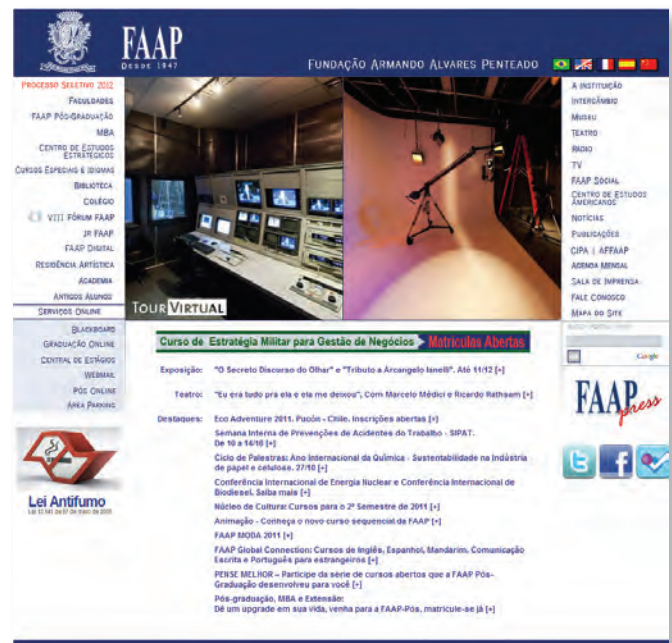
Portal FAAP – www.faap.br – terceira atualização.