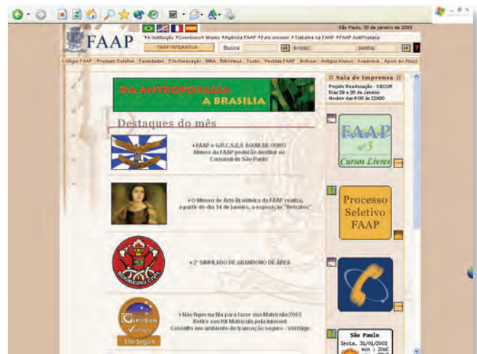
Lançamento do Portal FAAP – www.fAAP.br

A “ despapelização ” desses processos permitiu reduzir custos com a compra de papel e cartuchos de impressora e ganhar tempo no levantamento de informações importantes para a tomada de decisões.