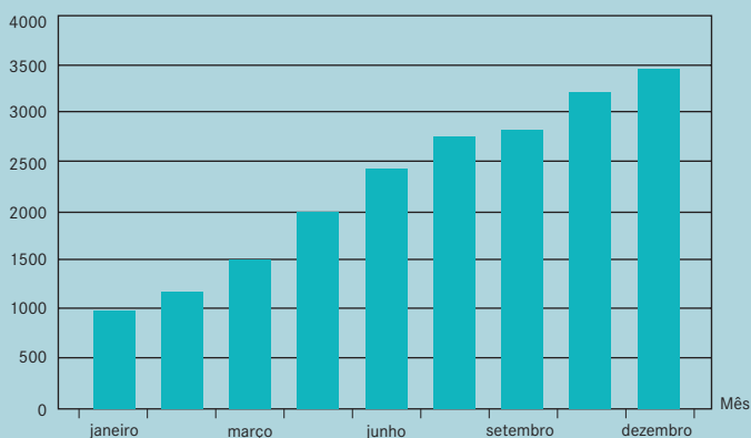
Figura 1 - Número de páginas