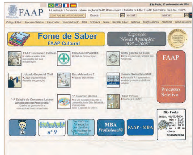
Portal FAAP – www.faap.br – primeira atualização.

O design mais limpo e o uso prioritário da cor branca proporcionam um ambiente mais arejado. O novo desenho traz mais imagens e em formatos maiores, para acompa-